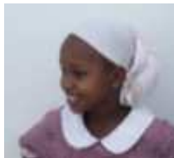
Regina 8 anni