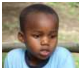
Festo 7 anni