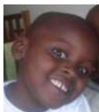
Godbless 8 anni