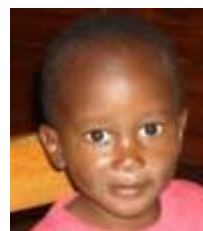
Comfort 4 anni