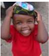
Siaeli 5 anni